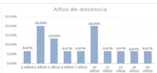
Gráfico 2: Frecuencia de la variable años de docencia

En cuanto a la a los años de docencia, se puede apreciar en el gráfico 2, que la parte de la muestra más destacada eran los que llevaban ejerciendo 3 años (20% de la muestra) y aquellos que llevaban 10 (20% de la muestra).