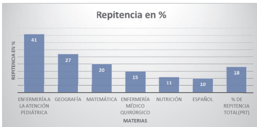
GRÁFICA # 2

Análisis: La gráfica # 2 señala que el 18% de las repitencias de los años 2016 y 2017 en la Licenciatura en enfermería están concentradas en 6 materias. Comprendidas en asignaturas de la especialidad y complementarias.