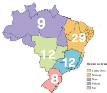
Figura 1. Participantes inscritos na FCDI por região do Brasil

Desses 69 inscritos, sessenta e seis profissionais são atuantes nas unidades especializadas da APAE e três são acadêmicas do GEPEEDI. Entre os 66 profissionais, 55 preencheram a caracterização inicial.