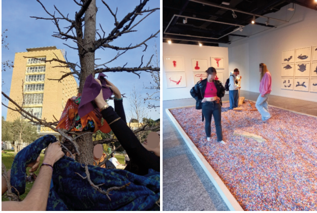
FIGURA 2. Taller 15- El aula creativa-invertida.